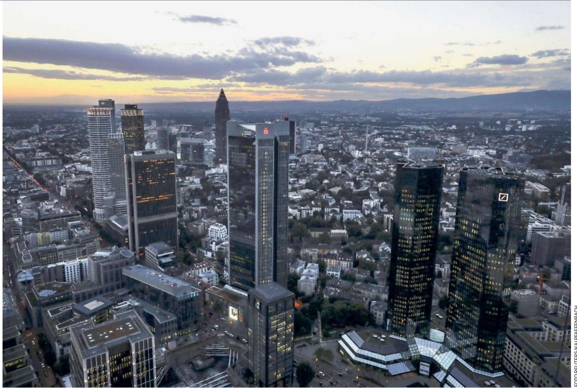
De skyline van Frankfurt met rechts het hoofdkantoor (de twee zwarte torens) van Deutsche Bank.